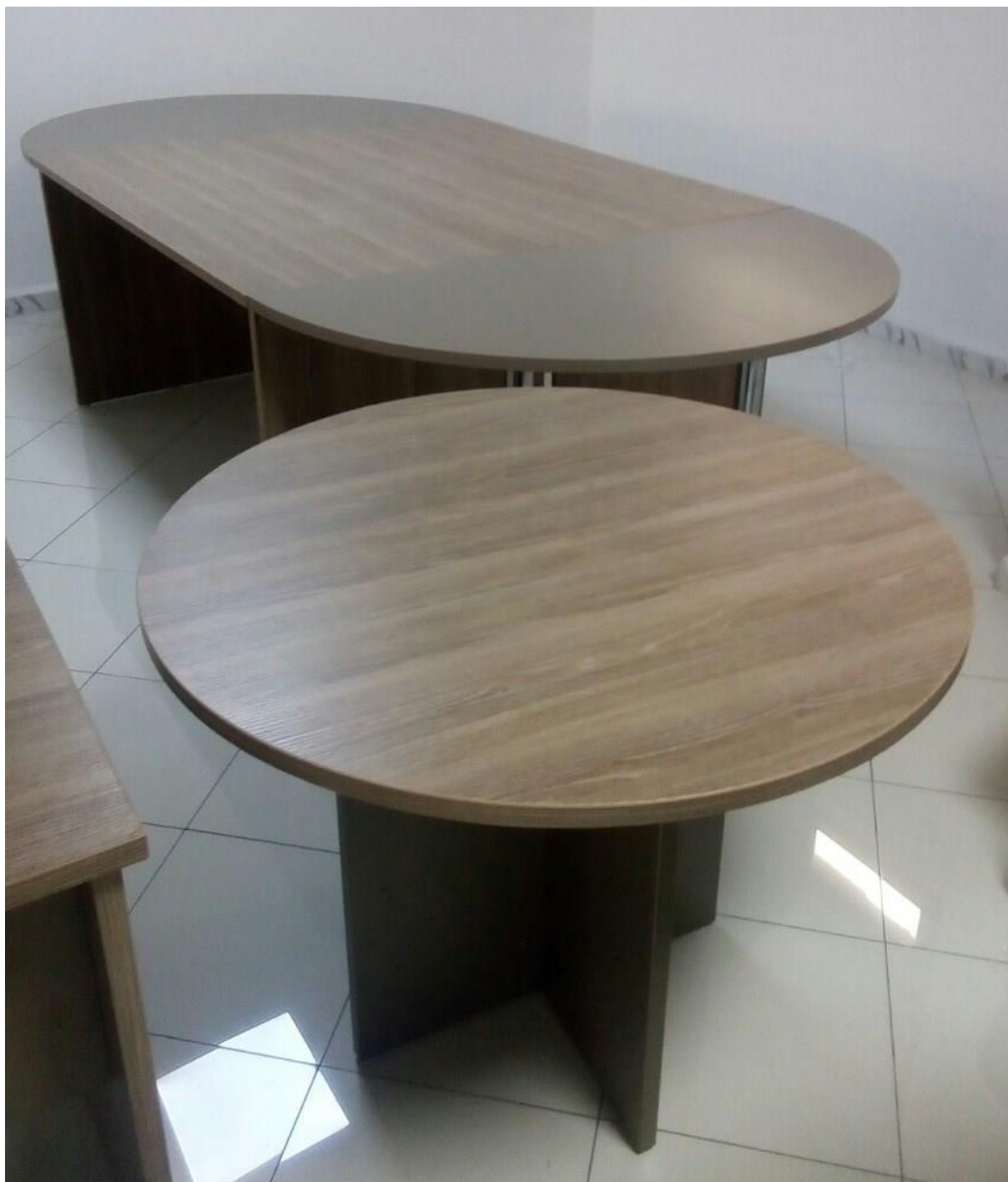
Table de réunion rectangulaire 2m/1m et ronde 1m/1m fabriqué en mélamine.