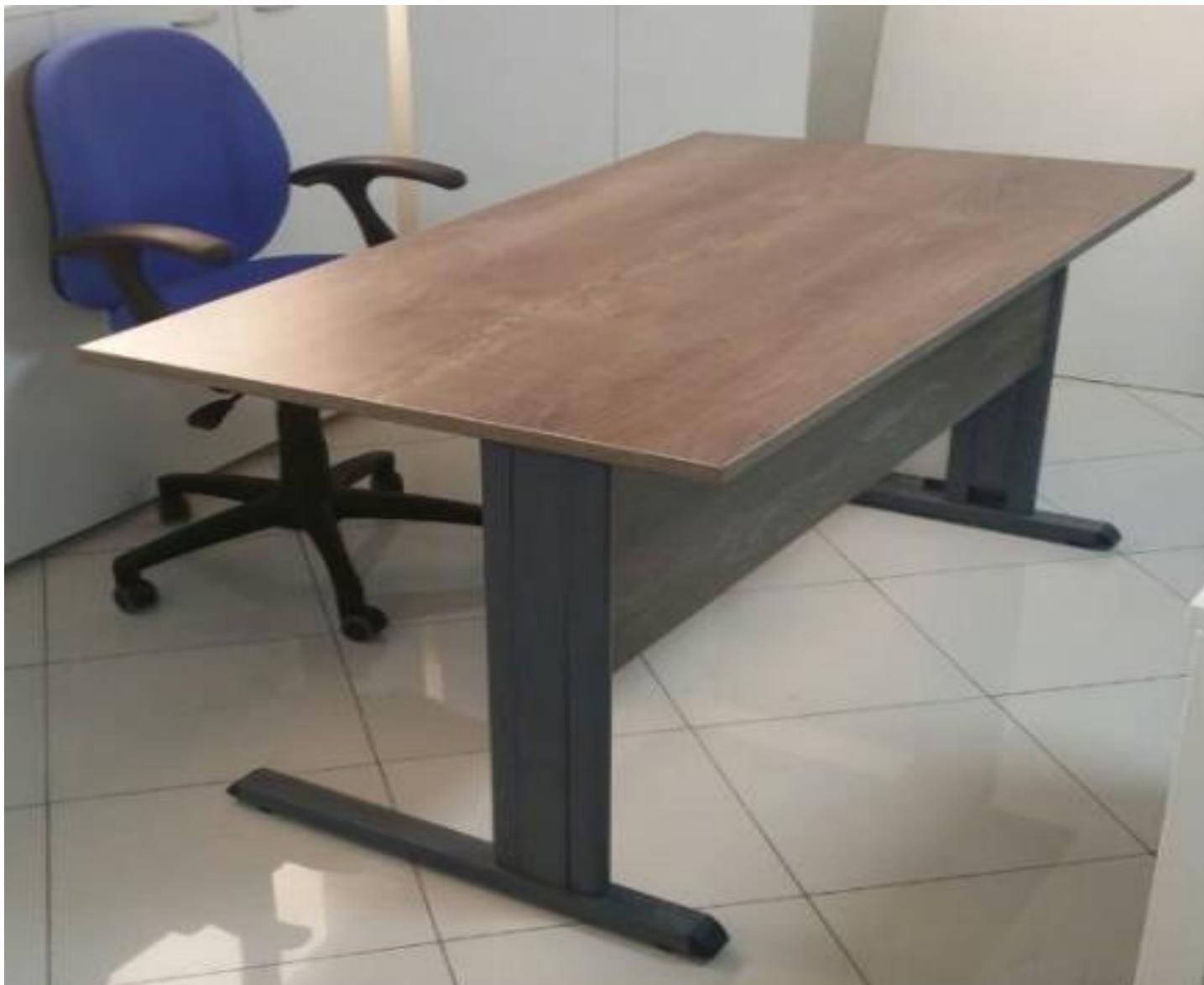
Bureau fabriqué en mélamine avec piètements métalliques Disponible dimensions 1.20/0.75, 1.40/0.75.