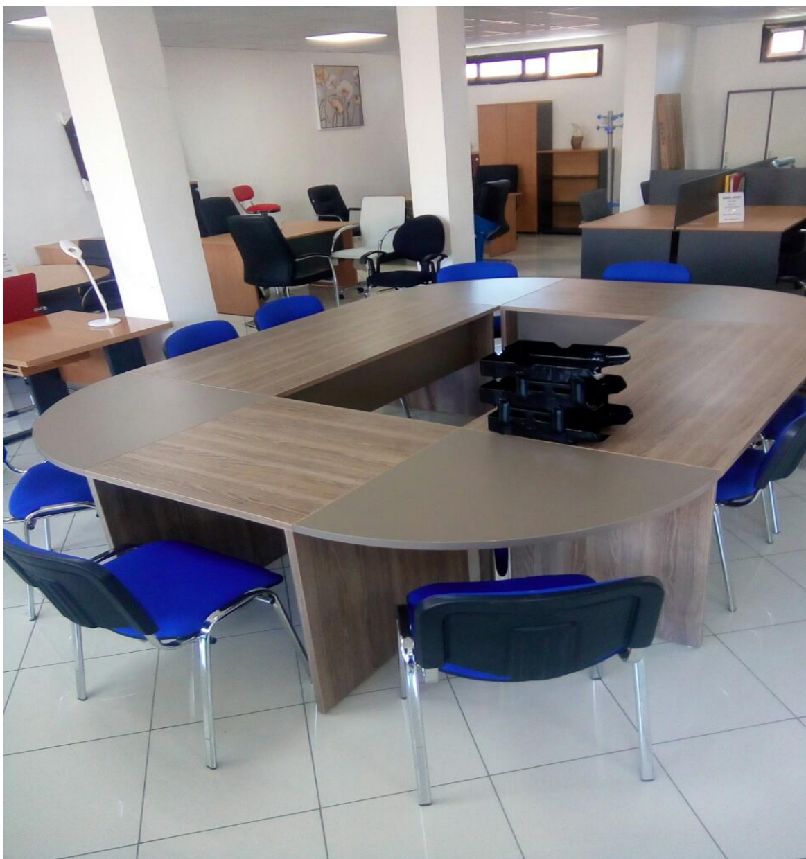
Table de réunion modulable composée de 4 bureaux et 4 jonctions pour former un « O »

Nombre de bureau facultatif par rapport à la longueur souhaité.