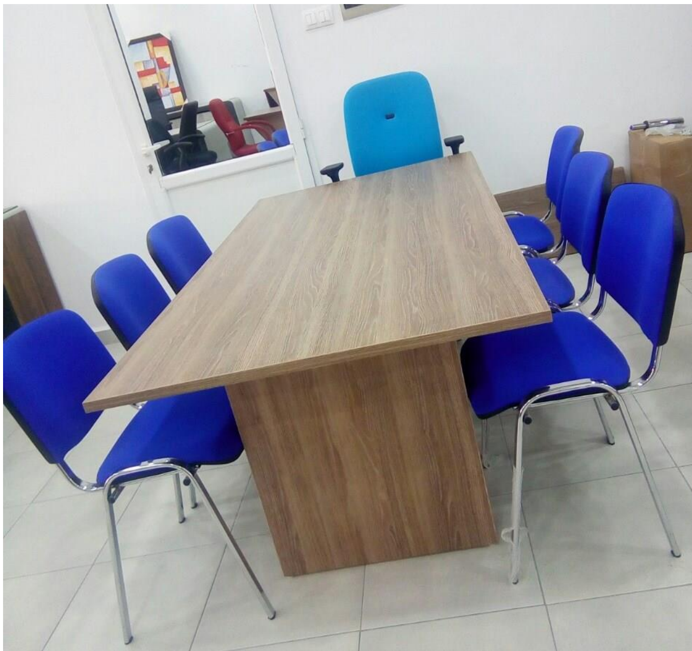
Table de réunion 2m/1m fabriqué en mélamine